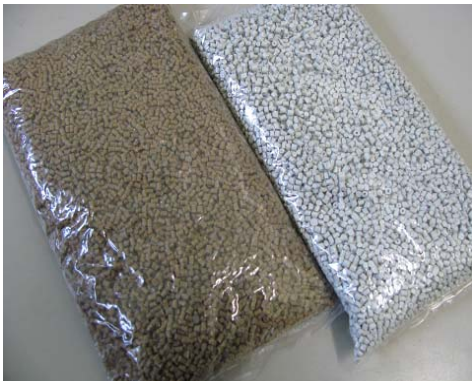
(上記製品に袋は含みません)

主成分: PBT (Polybutylene terephthalate) リサイクル率: 100% (リサイクル率は樹脂分にしめるマテリアルリサイクル材料で70%以上とする) 主な用途: 工業用途 リサイクル原料の回収場所: 市場回収 回収品由来: プレコンシューマ品 または 単一なポストコンシューマ品 (表示はすべて製品1kg当たりの数値です)