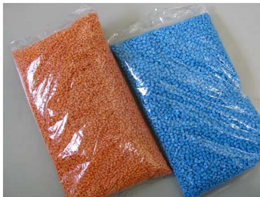
(上記製品に袋は含みません)

主成分: Polyamide6(70%) ガラス(30%) リサイクル率: 100%(リサイクル率は樹脂分にしめるマテリアルリサイクル材料の含有率で、70%以上とする) 主な用途: 工業用途 リサイクル原料の回収場所: 市場回収 回収品由来: プレコンシューマ品 または 単一なポストコンシューマ品 (表示はすべて製品1kg当たりの数値です)