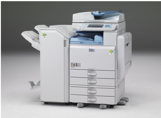
写真は、imaggio MP5000RC本体にSR3020RCフィニッシャーを装着したものです