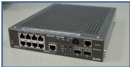
※電源コード(外付け)を含む